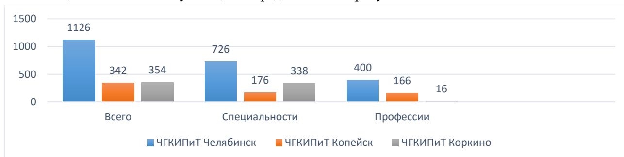
Рис. 1. Общая численность обучающихся

Общая численность обучающихся представлена на рисунке 1.