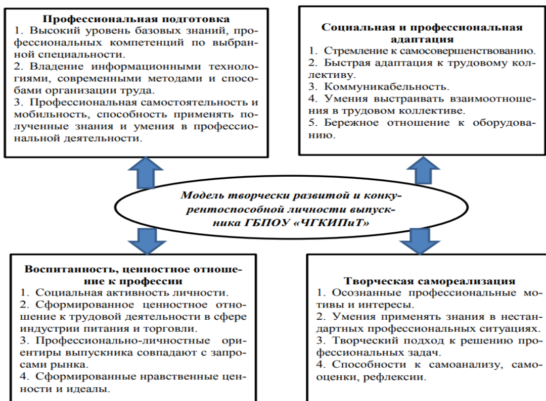
Рис. 1 Модель выпускника ГБПОУ «ЧГКИПиТ»

Концепция качества образования базируется на компетентностном подходе в образовании, что в корне изменяет роль преподавателя в образовательном процессе – его переход с позиции транслятора знаний в организатора учебного процесса, направленного на привитие обучающимся самостоятельности и ответственности за результаты обучения.