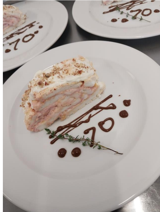
Десерт Анны Павловой